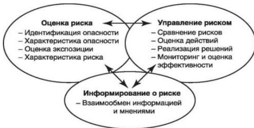
Рис. 3. Процесс оценки риска

также дополняться методологическим подходом к количественной оценке приемлемого уровня риска (рис. 3) [7].