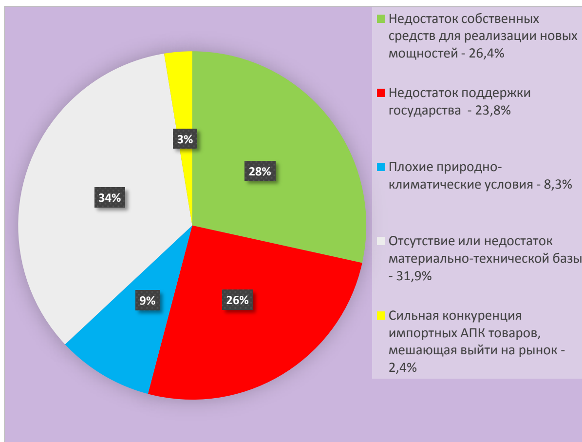
Рис. 1. Результат опроса новосибирских аграриев о том, что мешает им выполнять требования продовольственной доктрины

Автор провел независимый опрос среди новосибирских аграриев и выяснил, что мешает им полностью удовлетворить требования доктрины в сфере продовольствия. Результаты опроса представлены на Рисунке 1.