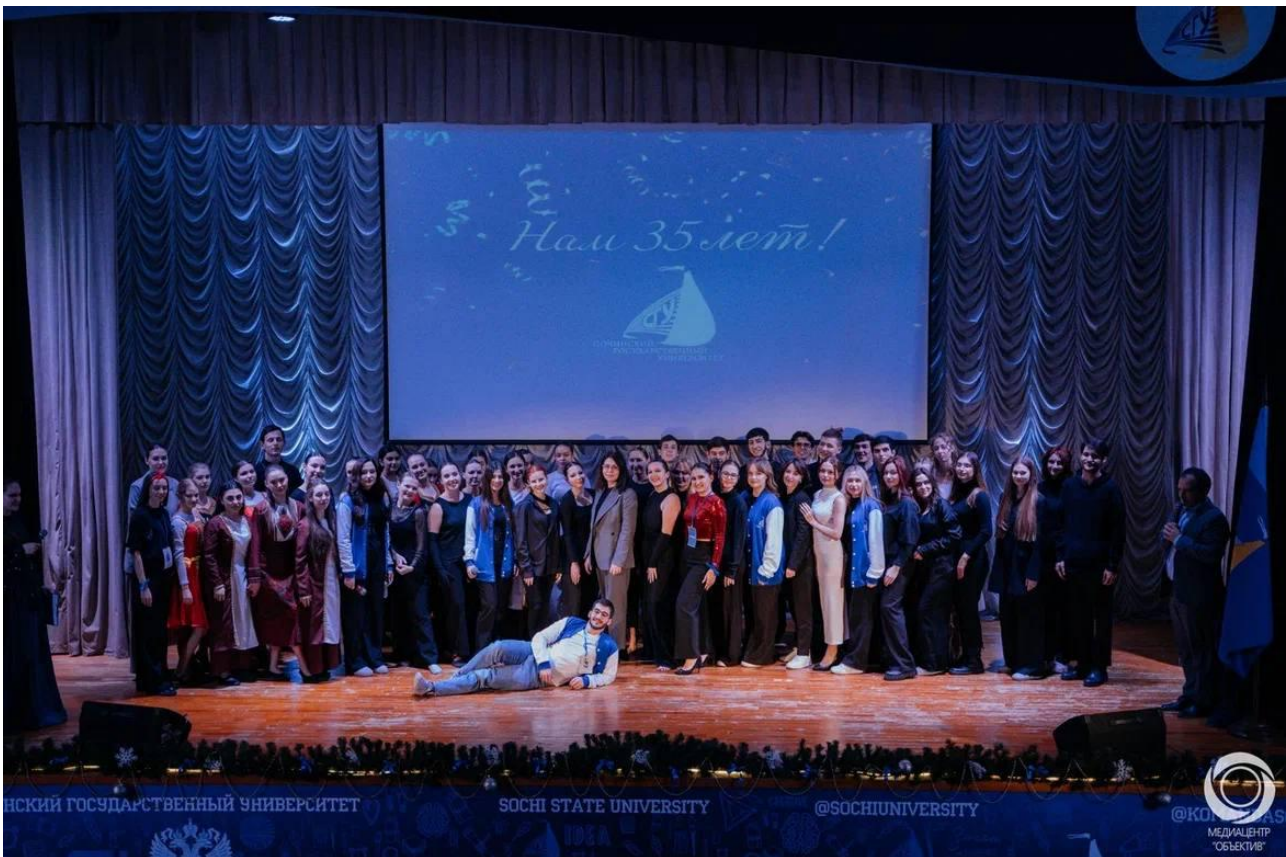
Рис. 2. Празднование 35-летия Сочинского государственного университета (20 декабря 2024 г.)

«Поздравляю Сочинский государственный университет с 35-тилетием! Университет стал альма-матер для многих талантливых людей, настоящих профессионалов своего дела.