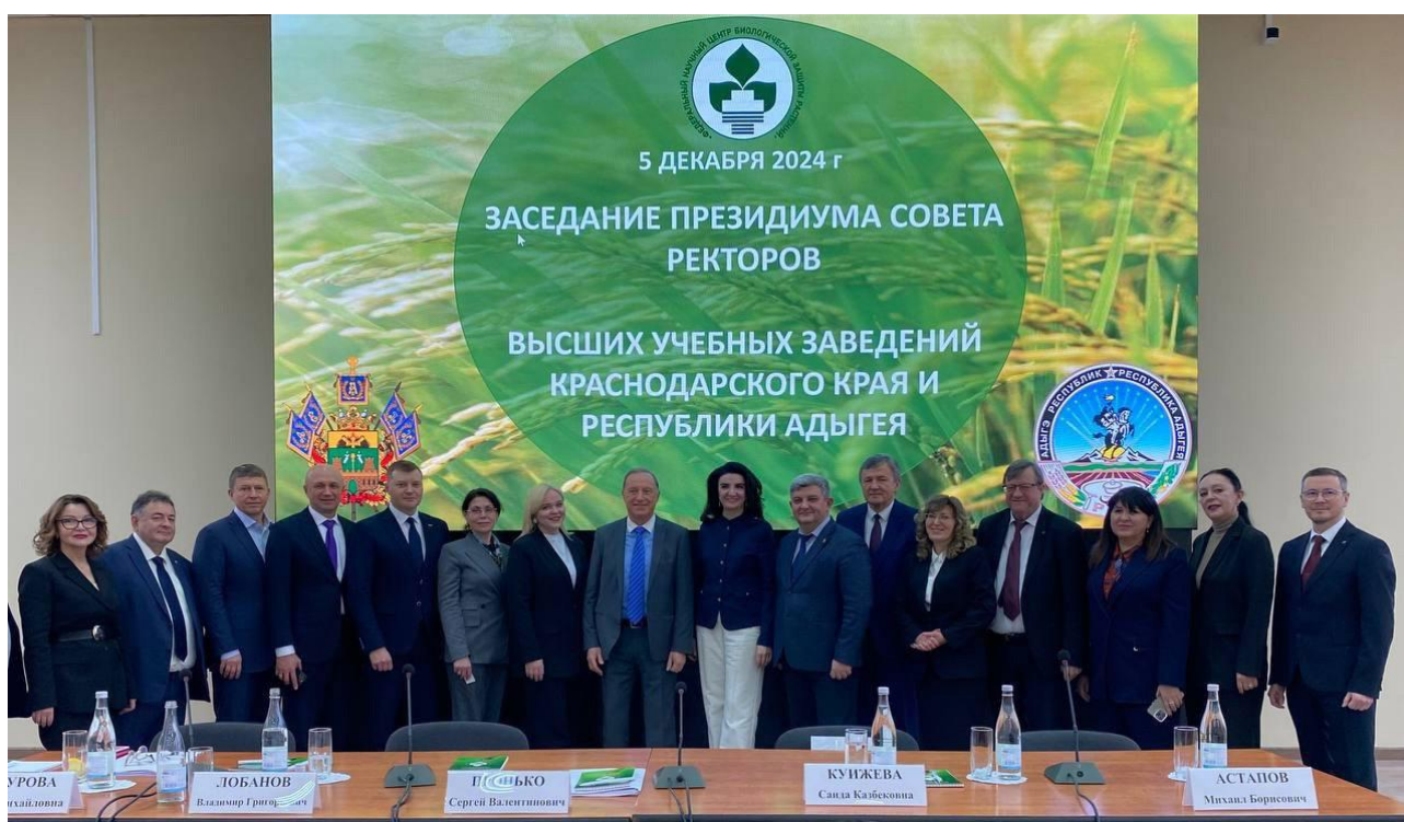
Рис. 1. Заседание президиума Совета ректоров высших учебных заведений Краснодарского края и Республики Адыгея (5 декабря 2024 г.)

Главный редактор, д.э.н., доцент Е.К. Воробей