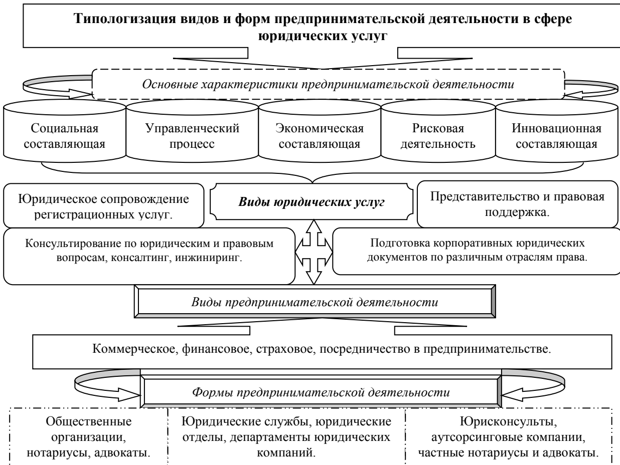
Рис. 1. Типологизация форм и видов предпринимательской деятельности в сфере юридических услуг

Основными направлениями и векторами развития современного предпринимательства в сфере юридических услуг, является выполнение задач, имеющих социально-экономический эффект при их реализации.